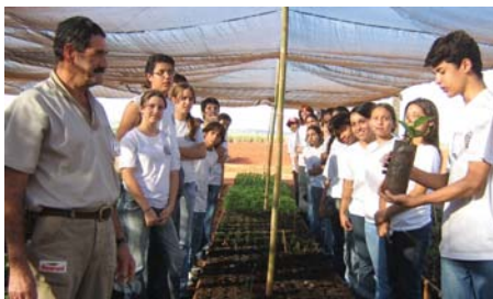
As visitas de escolas à empresa na qual os alunos conhecem os projetos ambientais da Guarani, como o viveiro de mudas (acima), é um dos exemplos de iniciativa na área de meio ambiente .... Página 4