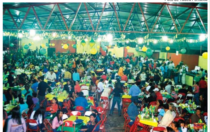
Ano após ano, a Festa Junina da Açúcar Guarani bate recorde de público. Em 2006, a grande procura fez com que a organização da festa tivesse que montar mais um barracão Página 10

Jornal interno da Açúcar Guarani S.A. Maio / Junho Ano 2006 nº 29 Distribuição gratuita